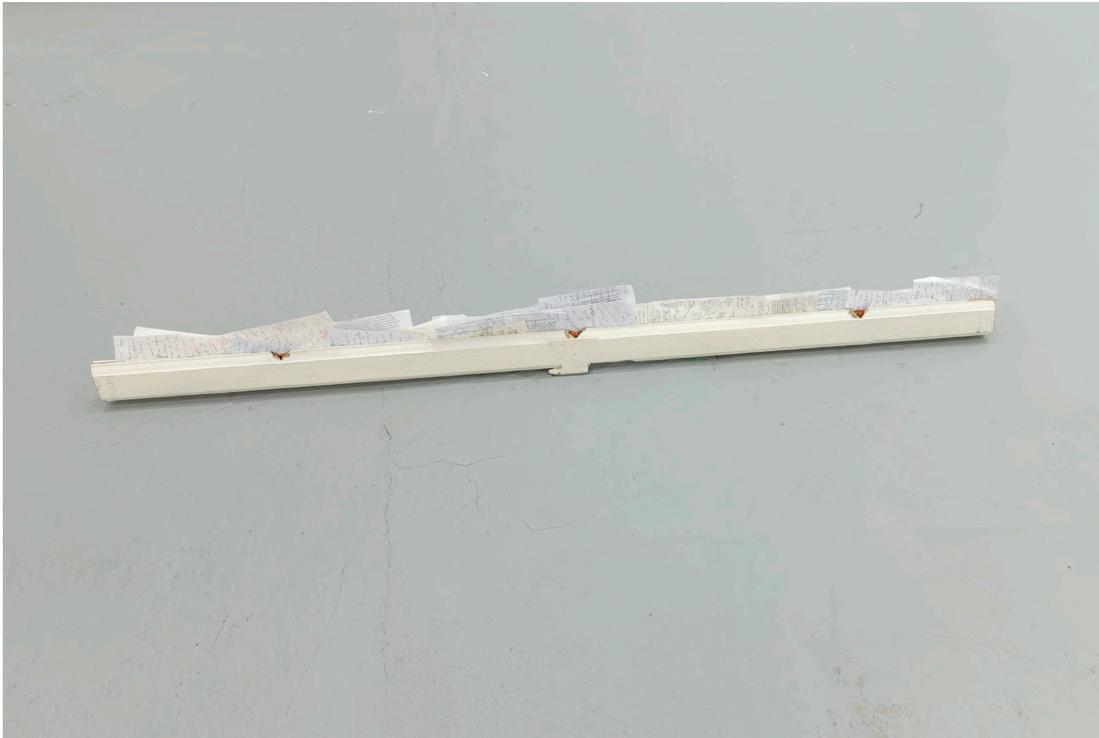
Window (Inventa e muori) 2025

Inventa e muori (Bruce Nauman), finestra, tickets, fogli di sala, ricevute, bugiardini/ Invent and die (Bruce Nauman), window, tickets, gallery handouts, receipts, package inserts, ink 12x18x190 cm